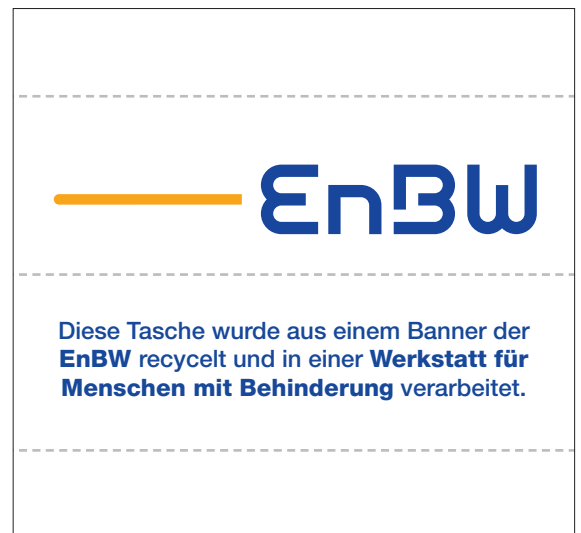
offen: 74 x 70 mm · eingenäht: 74 x 23 mm