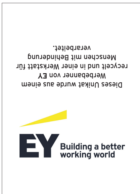
offen: 65 x 90 mm · eingenäht: 65 x 37 mm