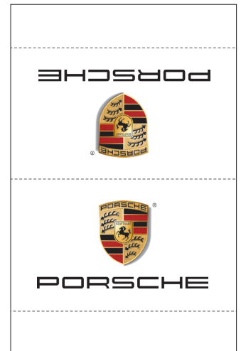
offen: 42 x 65 mm · eingen.: 42 x 24 mm