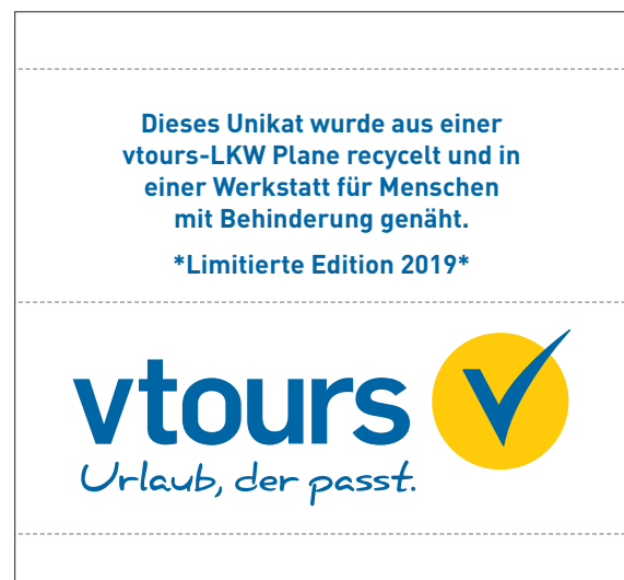
offen: 74 x 70 mm · eingenäht: 74 x 23 mm