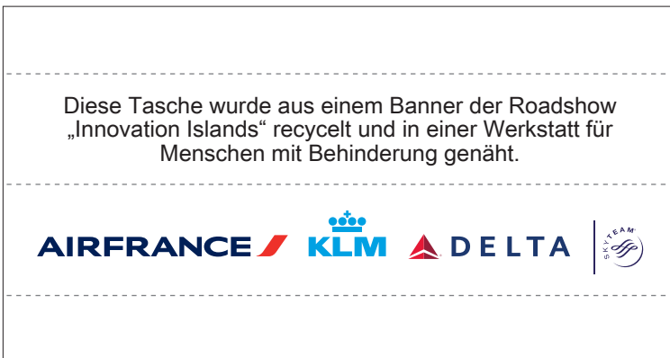
offen: 99 x 52 mm · eingenäht: 99 x 16 mm