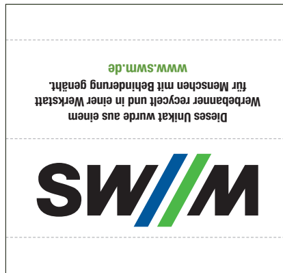
offen: 55 x 52 mm · eingenäht: 55 x 20 mm